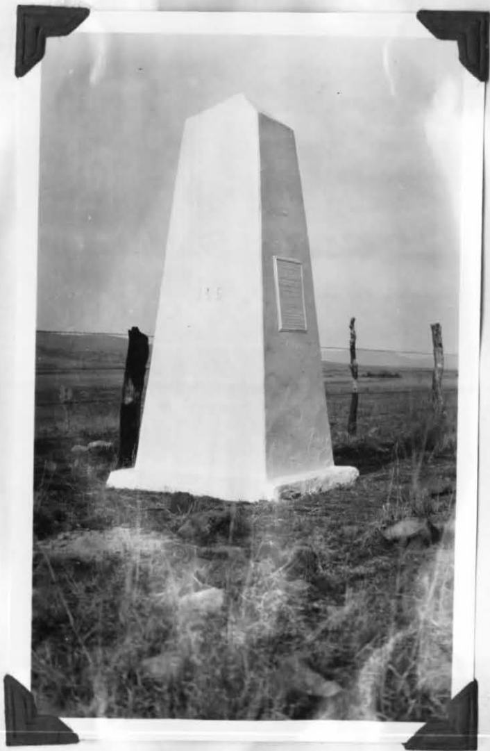
MONUMENT No 106