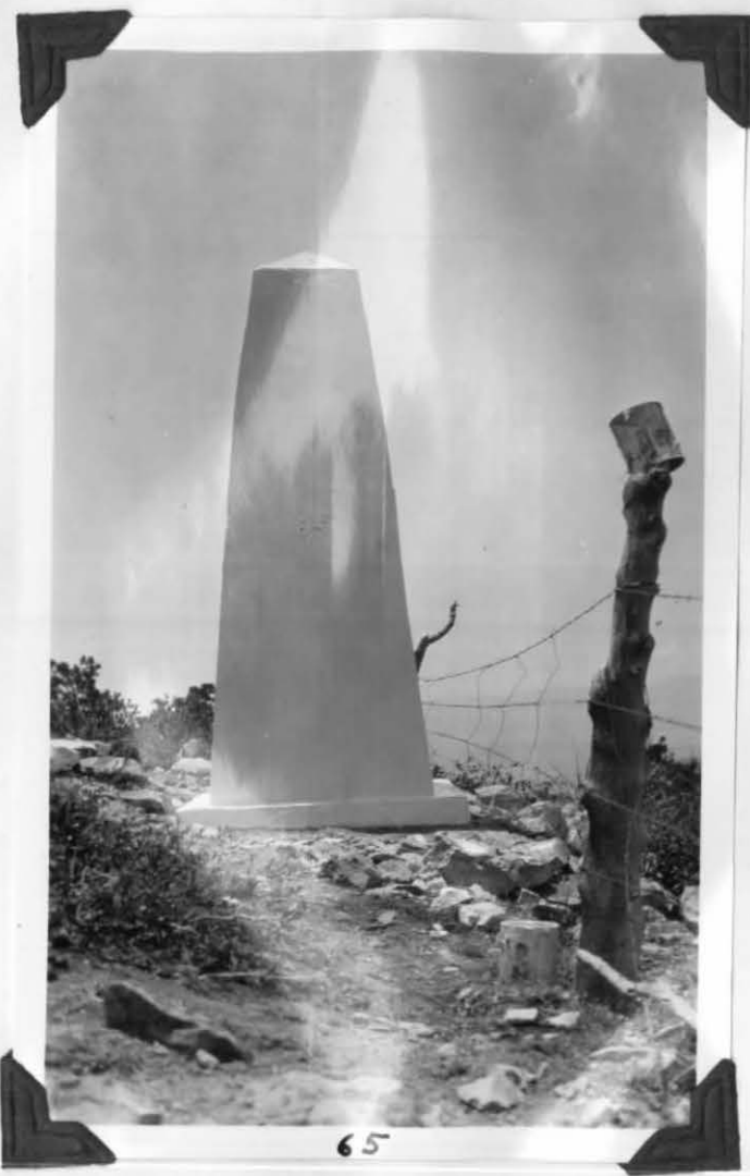
MONUMENT No 65