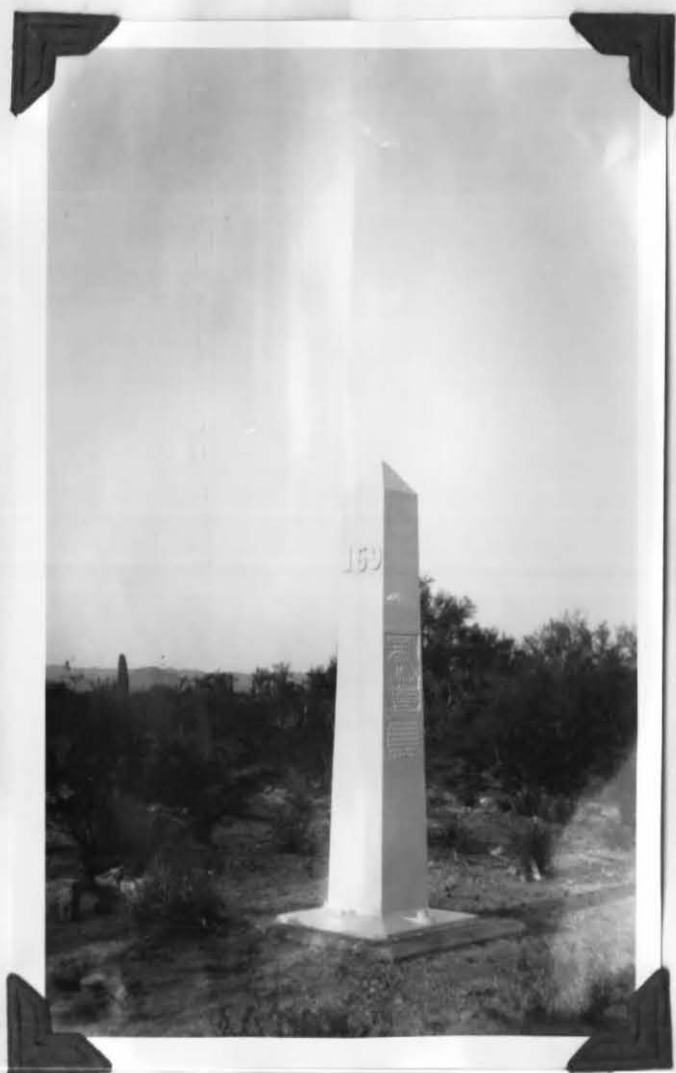
MONUMENT No 169