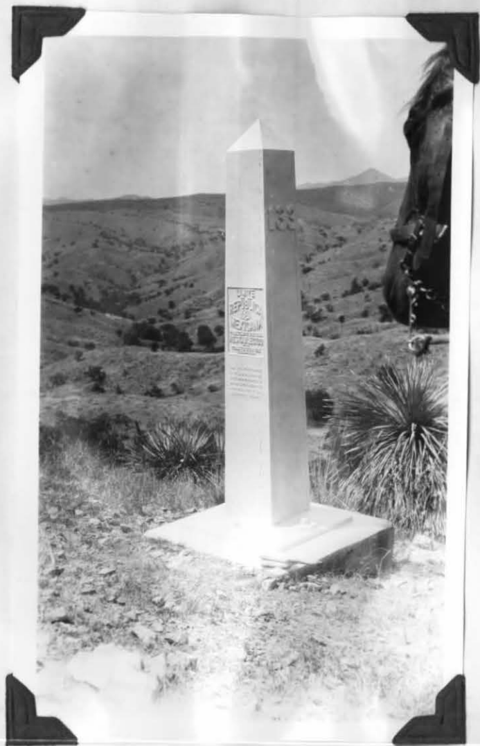
MONUMENT No 133