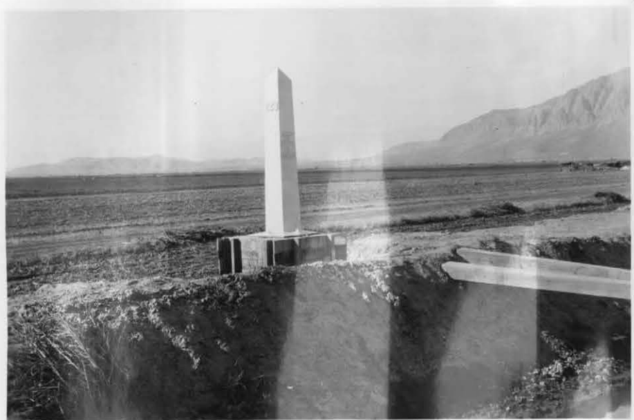
MONUMENT No 223