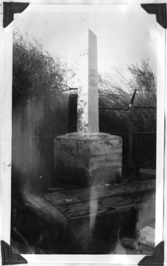
MONUMENT No 205