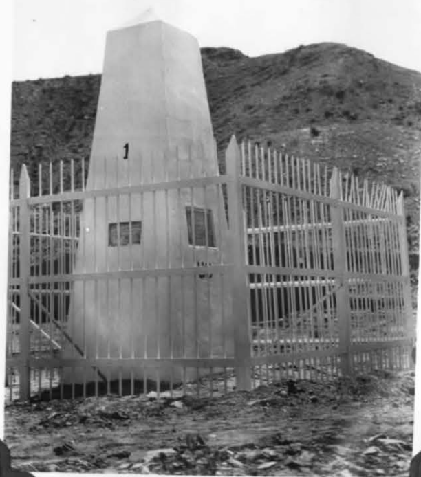
MONUMENT No 1