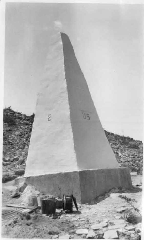
MONUMENT No 2