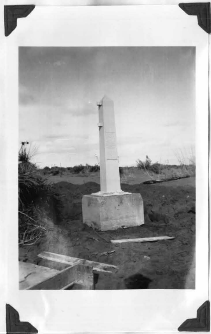
MONUMENT No 4