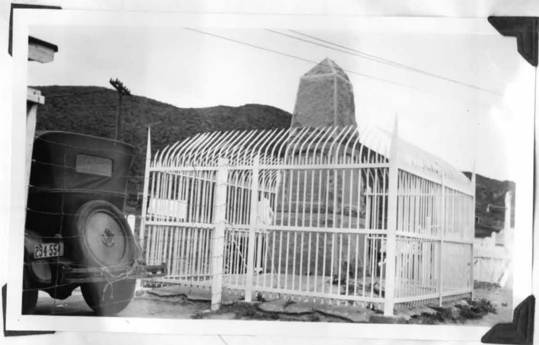
MONUMENT No 255