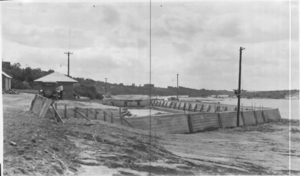
Vista que muestra los muros de concreto del balneario cons- truido en el cauce del Río Bravo en Laredo, Texas.