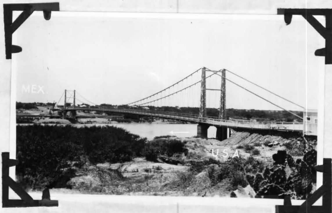
Puente Colgante Sobre el Río Bravo Entre San Pedro de Mier, Tamps., y Roma, Texas.